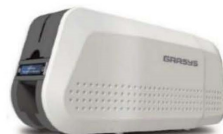
カードプリンター