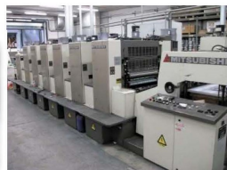
オフセット印刷機